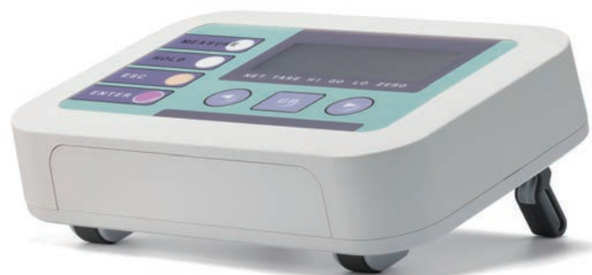
取り付け穴(フロント)

■ アルミケース・プラスチックケースどちらにも使用可能です。タカチ製品以外の筐体にもご利用頂けます。