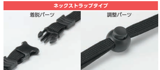
■ ネックストラップのみ着脱パーツと調整パーツ付です。